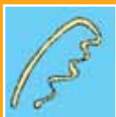
épingle à cheveux