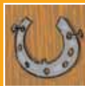
fer à cheval