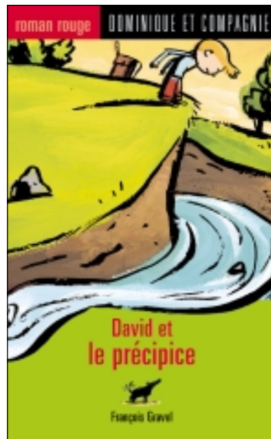
David et le précipice ISBN : 2-89512-222-9 N° de produit : 14-12859