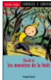
David et les monstres de la forêt ISBN : 2-89512-166-4 N° de produit : 14-12117