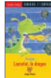
Lancelot, le dragon ISBN: 2-89512-164-8 N° de produit: 14-12112

Sélection de la Livromagie de Communication- Jeunesse 2001-2002