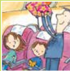
agent de bord