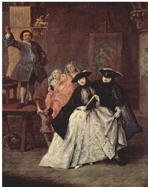
Le Charlatan par Pietro Longhi, 1757