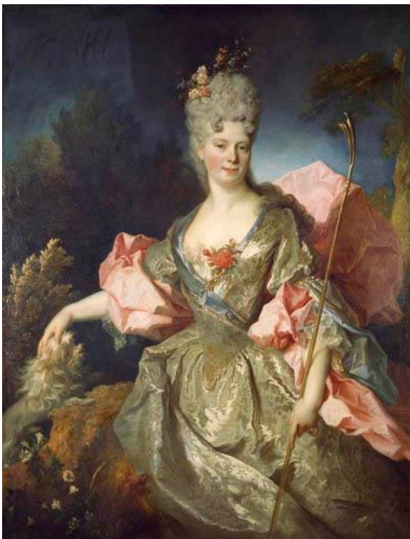
Portrait de la comtesse de Castelblanco par Largillière 1710

Un chien peint dans un tableau, c'est chouette ! Lequel te semble le plus plaisant à avoir pour compagnon ?