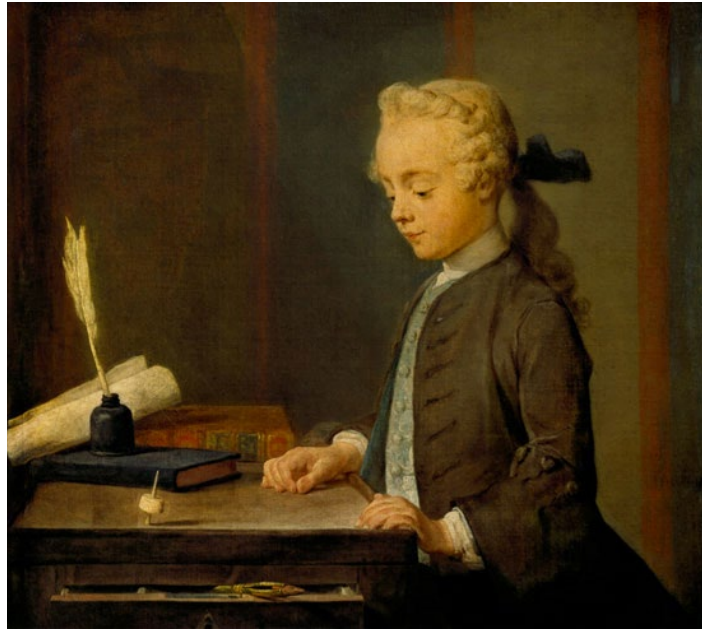
L'enfant au toton par Jean-Baptiste Chardin