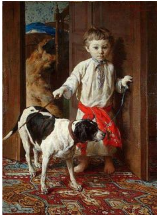
Le fils de l'artiste avec son chien par Pruszkowski