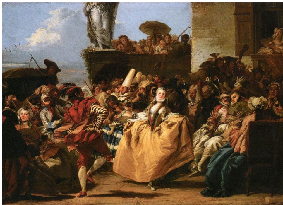
Scène de Carnaval par Gianbattista Tiepolo, 1756