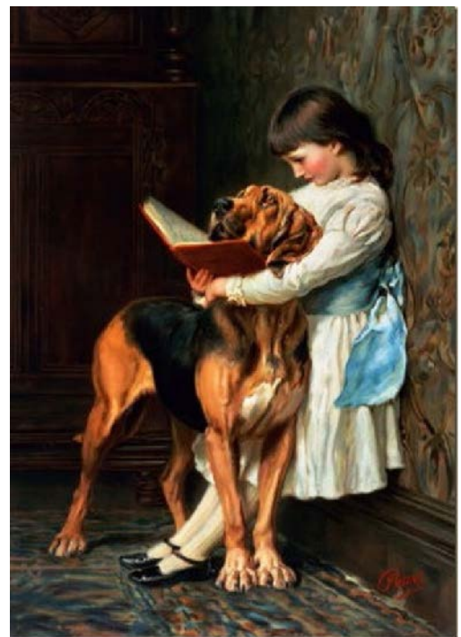
Compulsory education par Briton Riviere