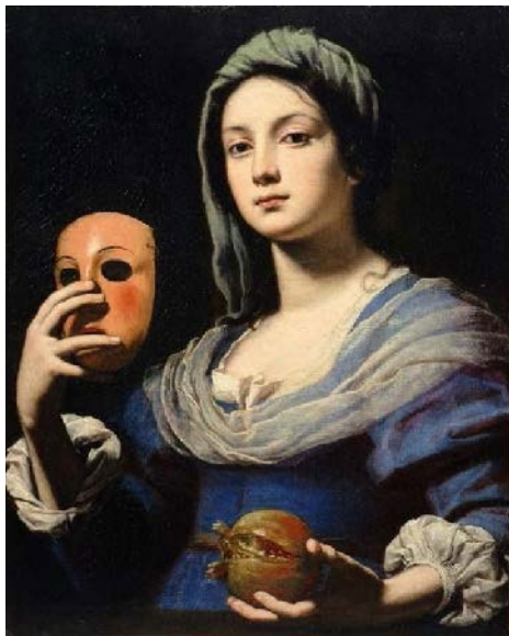
Femme au masque de Lorenzo Lippi vers 1650

Chouette, des personnages masqués ! Comme à l'Halloween ! À ton avis, lesquels se préparent pour une fête ?