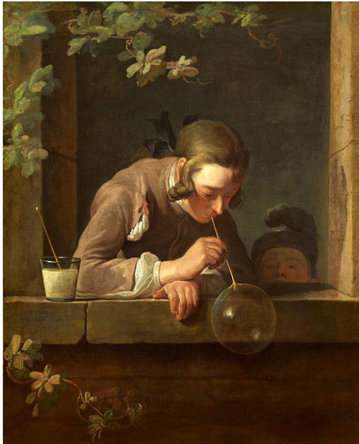
Bulles de savon par Jean-Baptiste Chardin

Les jouets existent depuis très longtemps. Ça, c'est certain ! Avec quoi s'amuse les personnages dans ces tableaux anciens ?