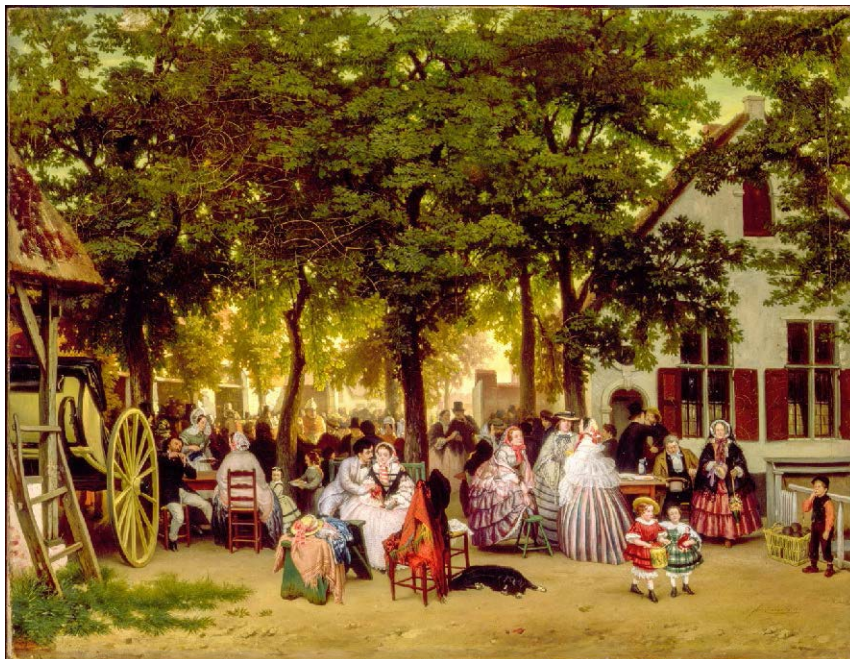
Après-midi à Anvers par Florent Crabeels 1860